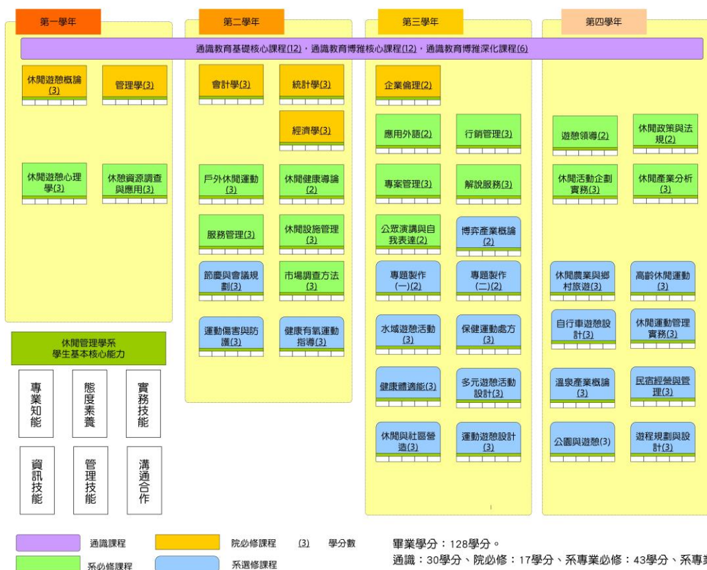
台灣首府大學 休閒管理學系(進修學士班)：課程地圖與職涯發展 (104學年度課規)